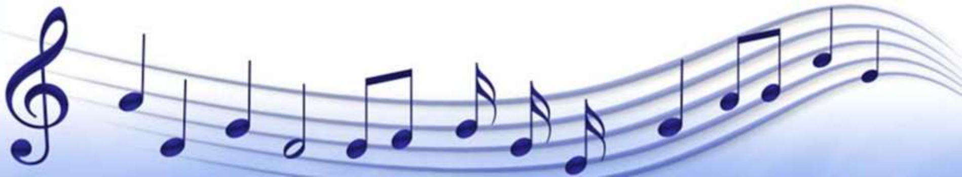
График работы Понедельник, вторник, среда, четверг, пятница – 8.00 – 16.50 Мероприятия Музыкальные занятия, разучивание танцев и постановок к утренникам, индивидуальные занятия, занятия кружков, развлечения и праздники, кукольные представления, концерты.